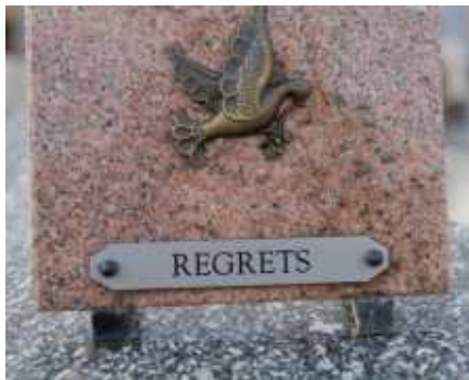
Graveren van gedenkplaten en grafstenen