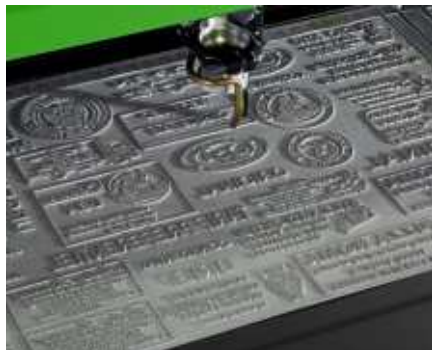
Graveren & lasersnijden van aangepaste inktstempels