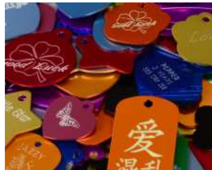
Graveren van tags voor huisdieren en honden