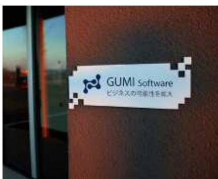
POP displays en signalisatie